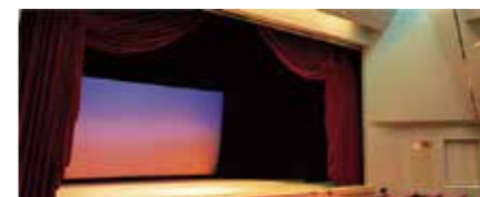
稲盛ホール / Inamori Hall