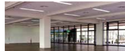
第1展示場 / Exhibition Hall 1

A multipurpose facility with exhibition halls from 591~5400m 2 , the 588 seat Inamori Hall that can accommodate international meetings, a lounge perfect for parties, and 7 conference rooms.