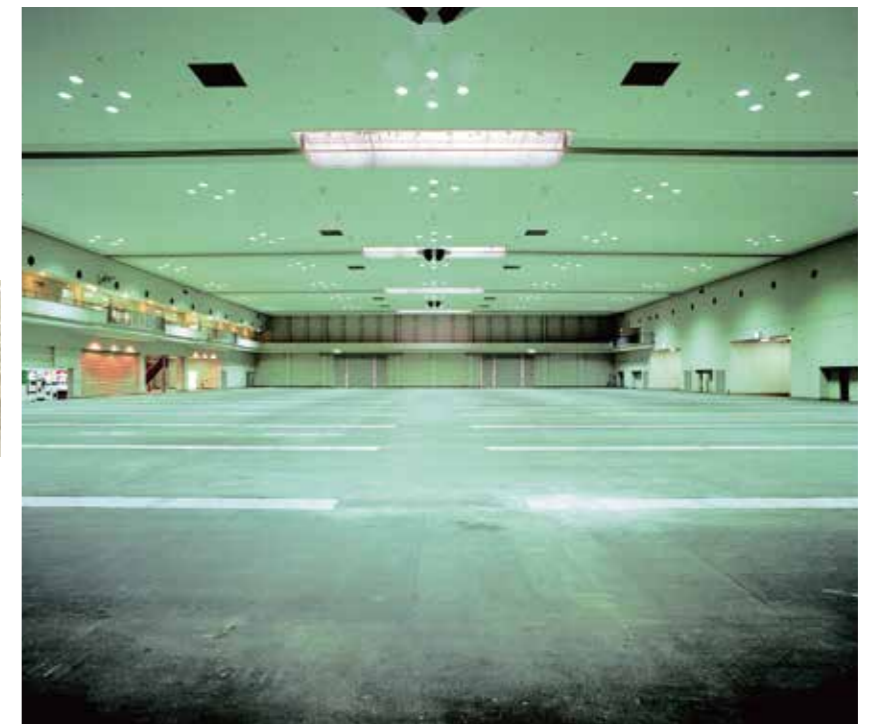
大展示場 / Main Exhibition Hall