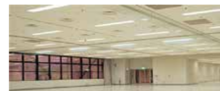
第2展示場 / Exhibition Hall 2