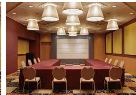
桂の間 / Katsura