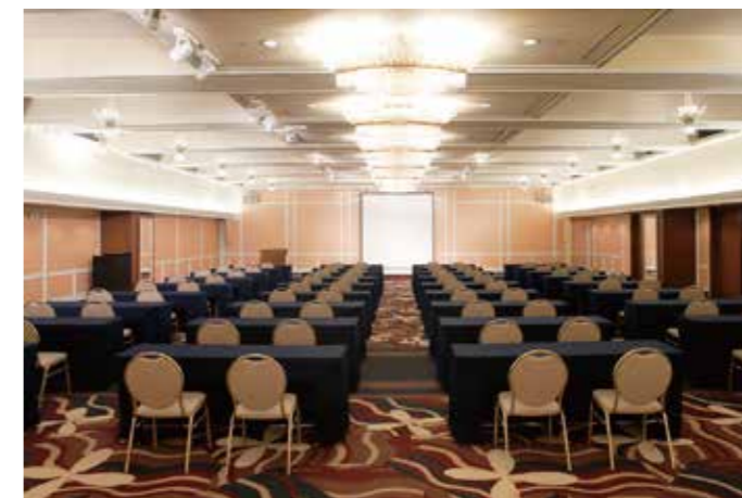
陽明殿 / Yomeiden