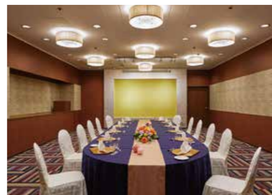
八坂の間 / Yasaka