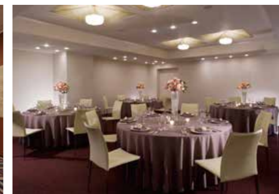
深草の間 / Fukakusa