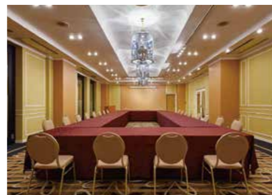
末広の間 / Suehiro