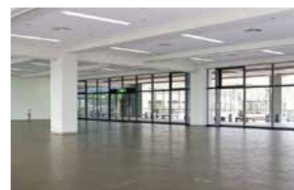
第1展示場 / Exhibition Hall 1