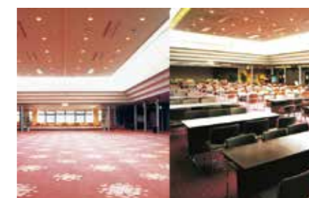
ラウンジ / Lounge