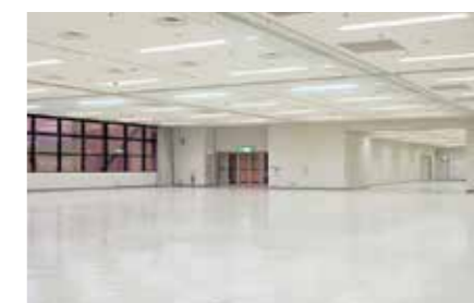
第2展示場 / Exhibition Hall 2