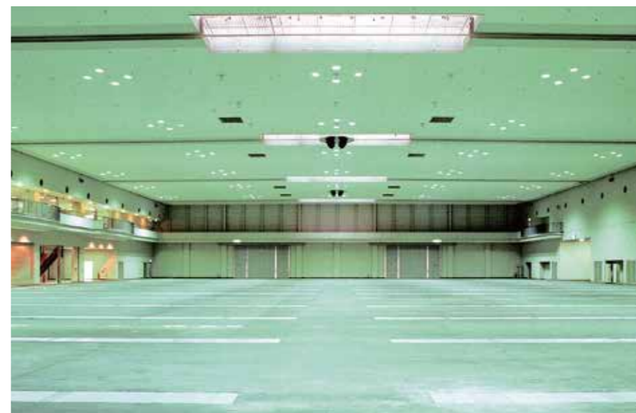
大展示場 / Main Exhibition Hall

・(*1) 平日 10 時間料金。・(*2) 平日 12.5 時間料金。・(*3) A区分使用：591 m 2 、B区分使用：1,000 m 2 。・(*4) 第4会議室のみ 16名。 ・(*1) Fee for weekdays (10 hours) / ・(*2) Fee for weekends (12.5 hours) / ・(*3) Section A: 591 m 2 , Section B: 1,000 m 2 / ・(*4) Conference Room 4 only: 16 persons