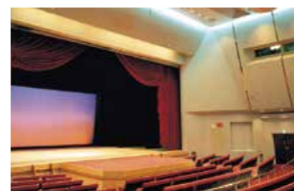
稲盛ホール / Inamori Hall