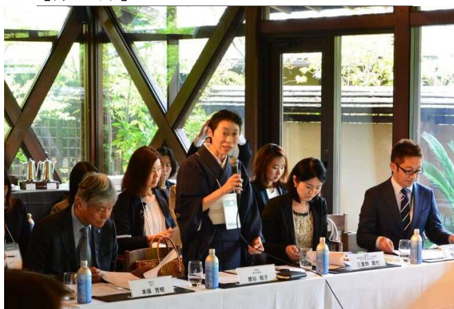
主催者挨拶（京都市 糟谷観光政策監）