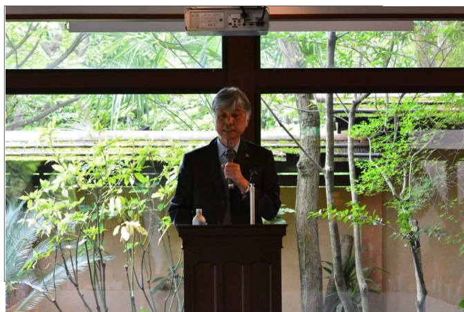
講演（観光庁 本保参与）