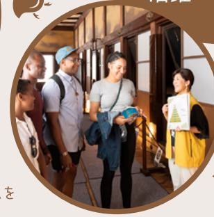
●二条城の公式ガイドとして英語ツアーを実施