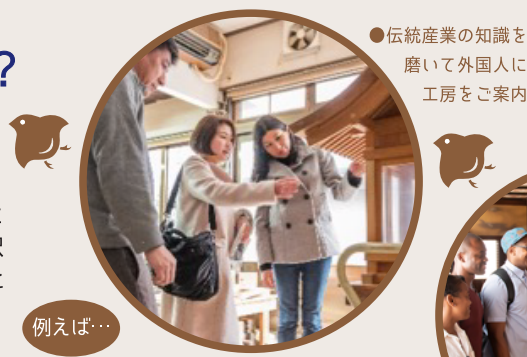
●伝統産業の知識を磨いて外国人に工房をご案内

通訳ガイド検索サイト『クレマチス』への登録、観光事業者とのビジネスマッチングや、スキルアップを目的とした研修への参加など、通訳ガイドとして活躍していただくためのサポートを行います。*個人の収入、その他の利益などを保証するものではありませんのであらかじめご了承ください。