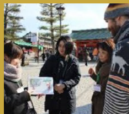
●基礎研修(実地研修)の様子