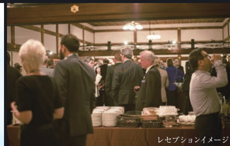
レセプションイメージ