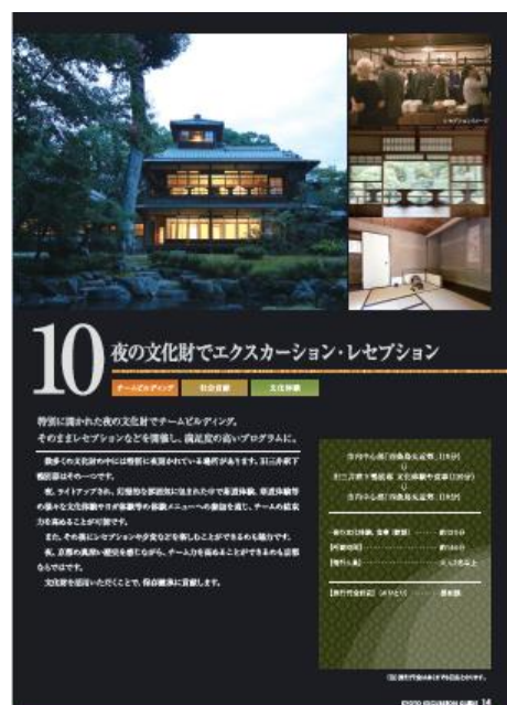
メニューページイメージ