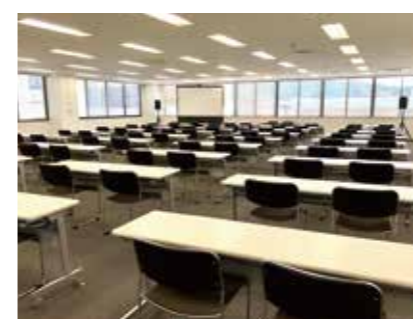
大会議室 / Large Conference Room