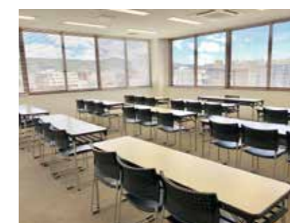
会議室 1 / Conference Room 1