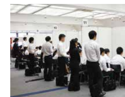
ホール全面利用例(就活イベント) Large Hall + Medium Hall