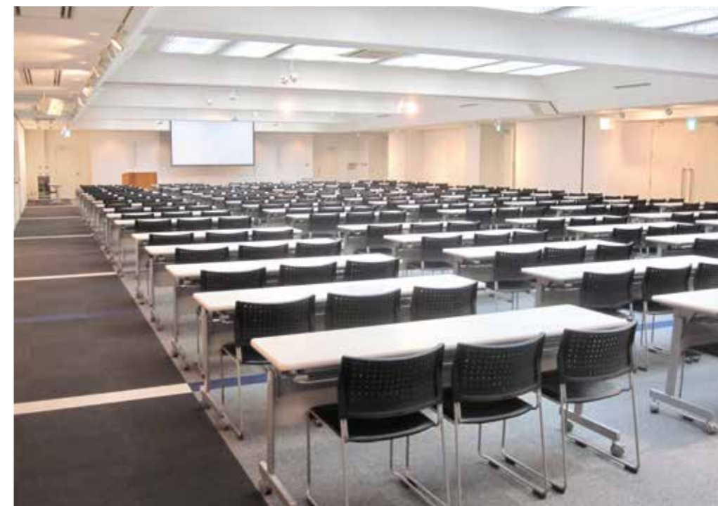
ホール全面利用 / Large Hall + Medium Hall