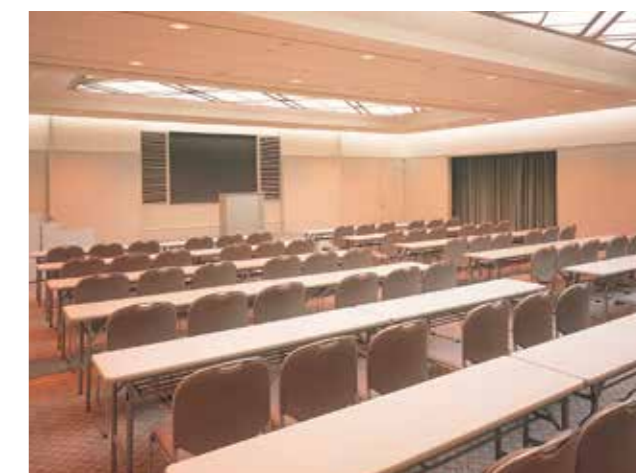
中会議室 / Medium Conference Room