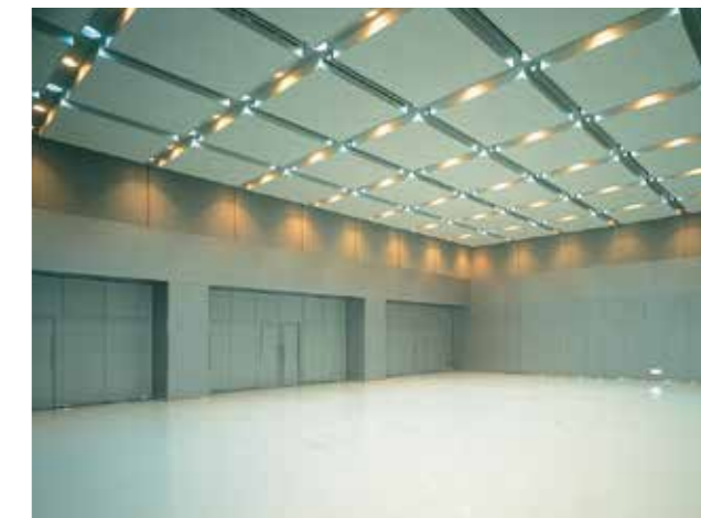
イベントホール / Event Hall

関西国際空港からけいはんなプラザ玄関まで直通リムジンバス運行、ホテル併設で大変便利です。 京都・大阪・奈良の中心に位置し、当地ならではの環境やおもてなしを提供いたします。