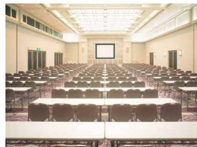
大会議室 / Large Conference Room