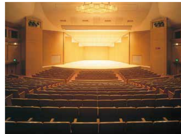
メインホール / Main Hall