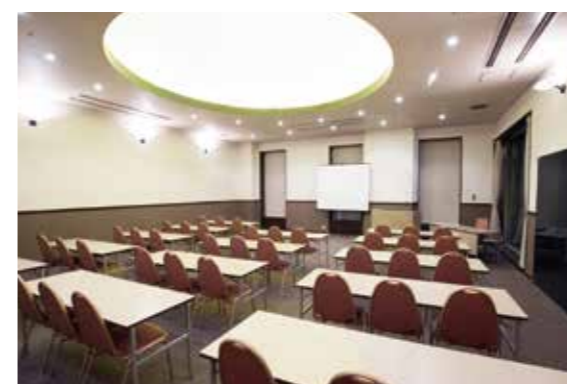
会議室 6 / Conference Room 6