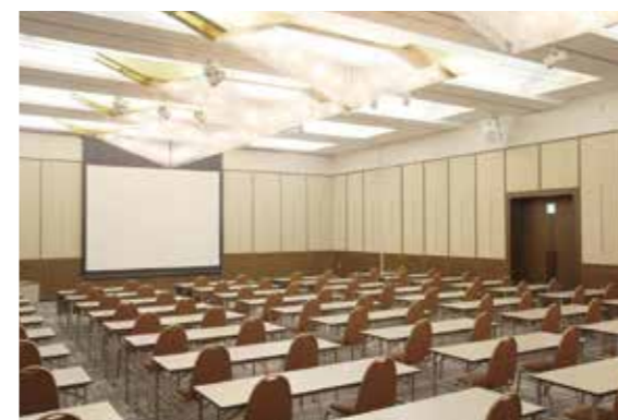
会議室 C / Conference Room C