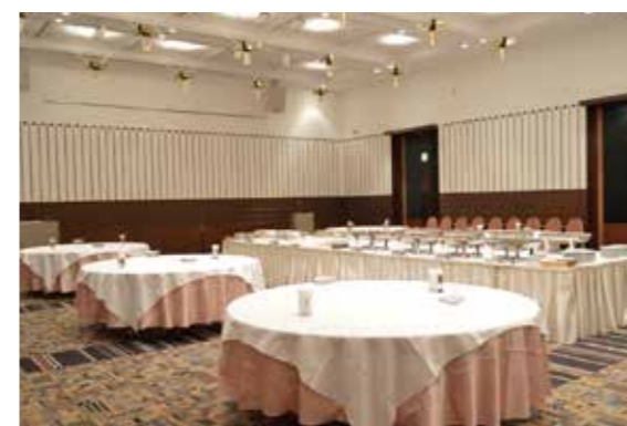
会議室 A / Conference Room A