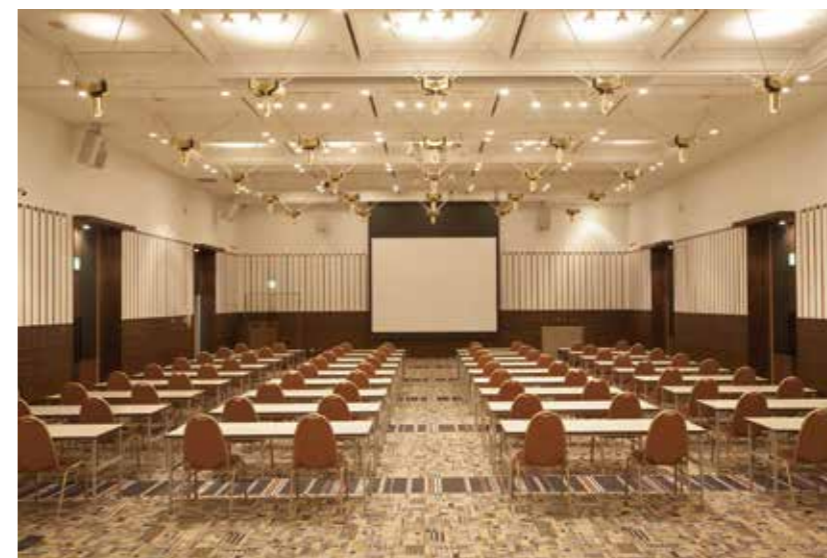
会議室 A / Conference Room A