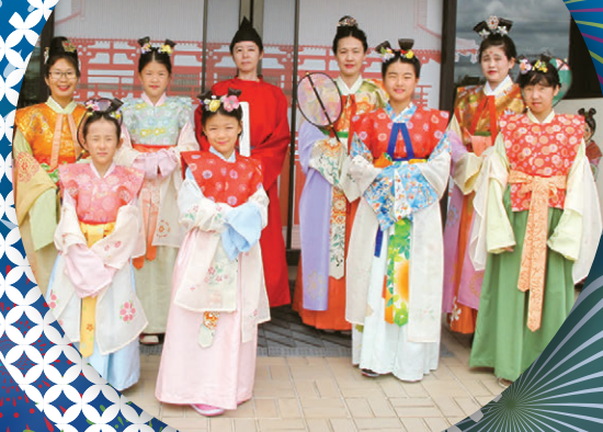
向日市文化資料館