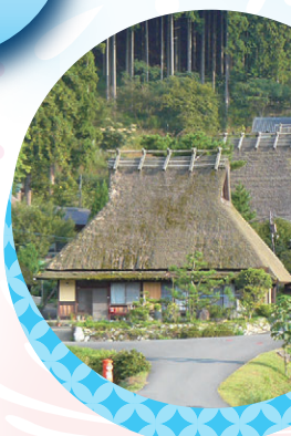
美山・かやぶきの里

3年に1回世界大会が開催され、2019年9月に日本で初めて開催される大会が京都大会です。