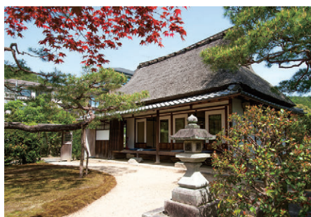
岩倉具視幽棲旧宅