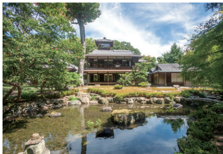
旧三井家下鴨別邸