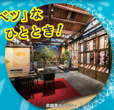
紫織庵ギャラリー