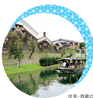
伏見・酒蔵の風景