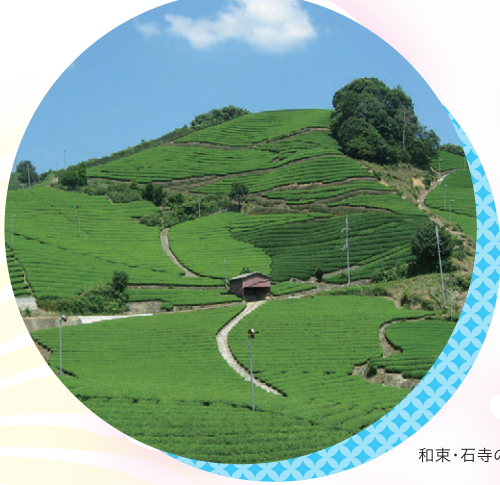
和束・石寺の茶畑