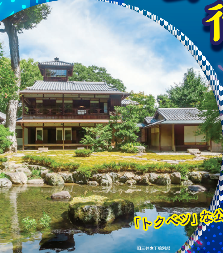
旧三井家下鴨別邸

この夏だけのスペシャルイベントが盛りだくさん! 京都市内・府内の いろんなミュージアム 114 館