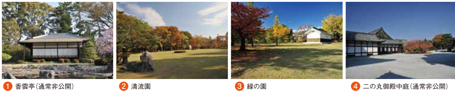
1 香雲亭(通常非公開) 2 清流園 3 緑の園 4 二の丸御殿中庭(通常非公開)