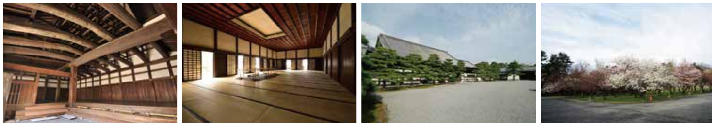
5 二の丸御殿台所(通常非公開) 6 二の丸御殿御清所(通常非公開) 7 二の丸御殿台所前庭(通常非公開) 8 桜の園