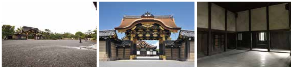
9 二の丸御殿前庭 10 唐門前庭 11 東南隅櫓(通常非公開)